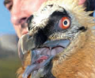
Quebrantahuesos, "el reintroducido" Bearded Vulture, "the reintroduced"