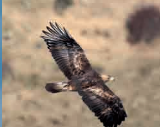
Águila real, "La reina" Golden Eagle, "The queen"