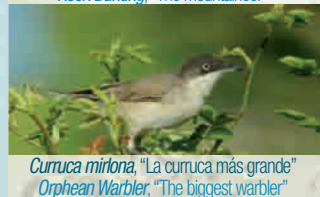
Curruca mirtona, "La curruca más grande" Orphean Warbler, "The biggest warbler"