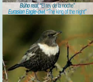
Mirlo capiblanco, "El de invierno" Ring Ouzel, "The wintering"