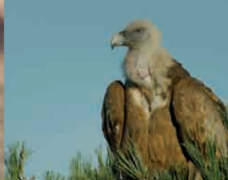
Buitre leonado, "El carroñero" Griffon Vulture, "The scavenger"