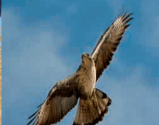
Águila-azor perdicera, "La reina del cortado" Bonelli's Eagle, "The most threatened"