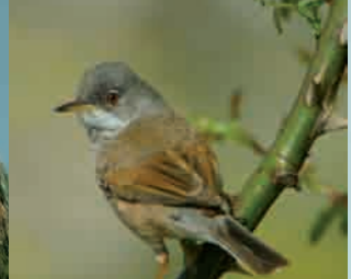
Curruca tomillera, "El duende del matorral" Spectacled Warbler, "The scrub elf"